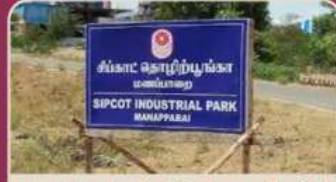
பணப்பாக்கம் சிப்காட் - 3 கி.மீ